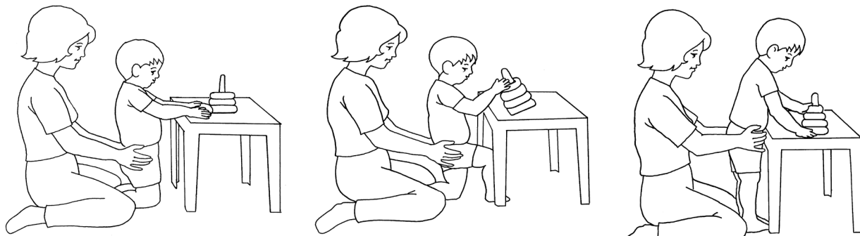
Ayude al niño para que aprenda a levantarse para ponerse de pie