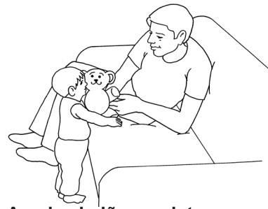
Ayude al niño a sujetarse a un mueble sólido y a aprender a mantener el equilibrio

El niño estará más seguro en un corralito que en un andador.